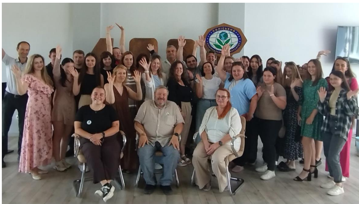
Obrázek 4: Účastníci kurzu v Žitomyru