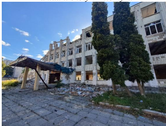
Obrázek 3: Vybombardovaná budova základní školy v Žitomyru