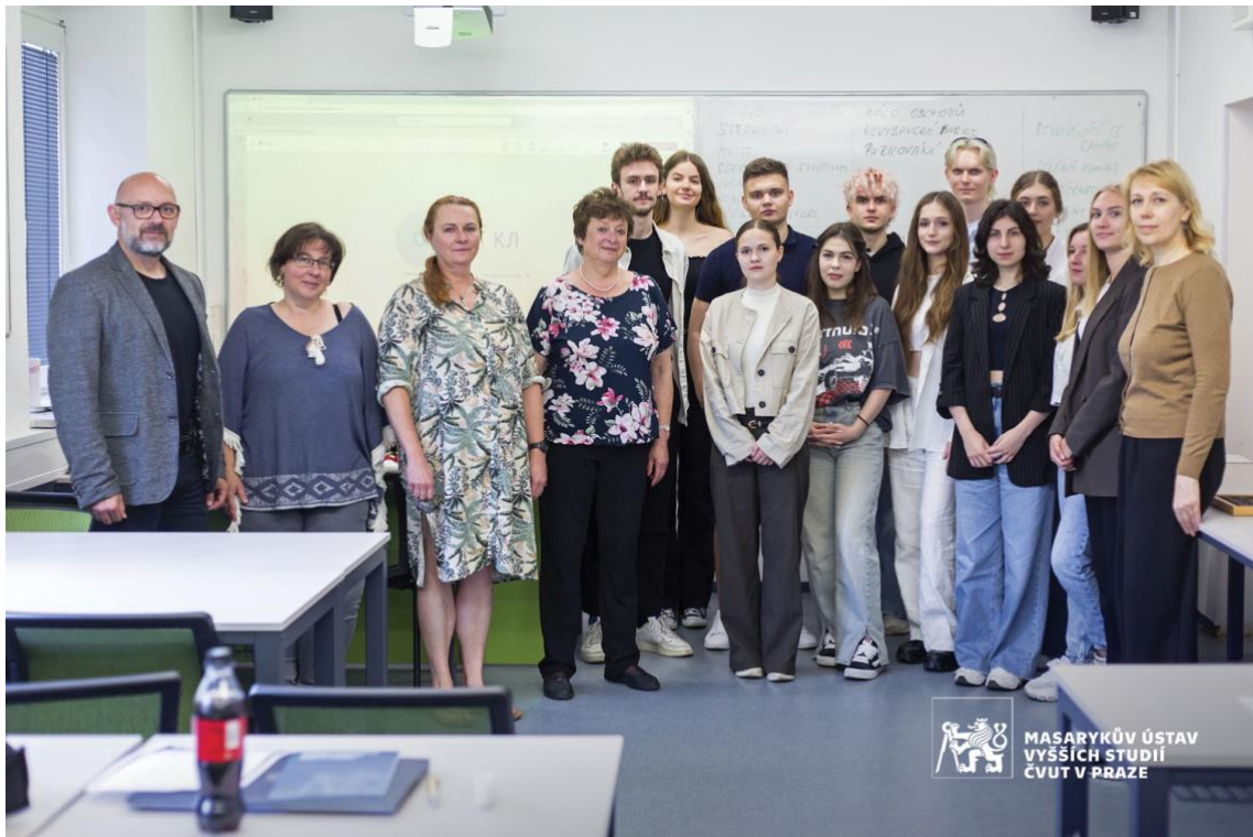
Obrázek 1: Účastníci pilotního kurzu s jeho realizátory