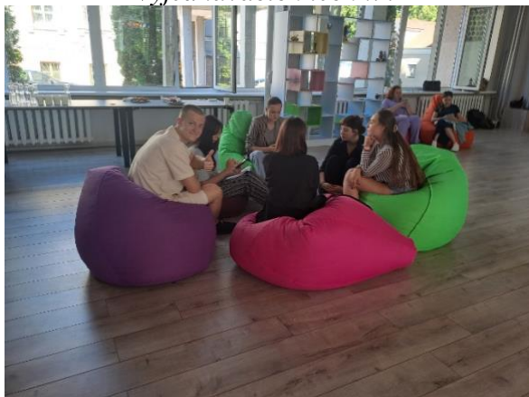
Obrázek 2: Účastníci kurzu během nácviku vyjednávacích technik